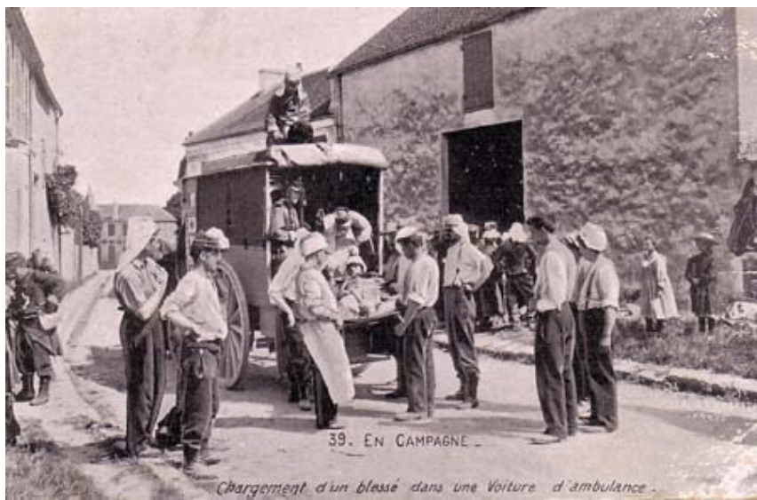
39. EN CAMPAGNE Chargement d'un blessé dans une Voiture d'ambulance.