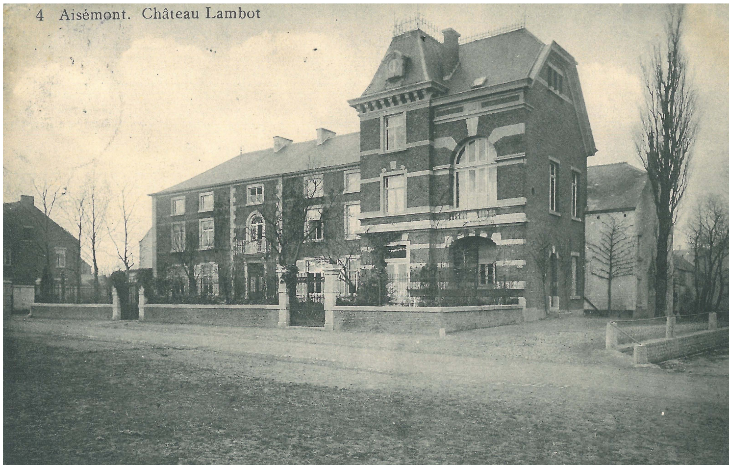
4 Aisémont. Château Lambot

La ferme Henquimbrant porta aussi les noms de Ferme Libouton, Arnould, Hanus et fut occupée en